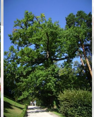
[© Tiziano Fratus, 2010 – Parco di Villa Mirabello]